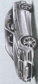
Classe C Nouvelle Génération