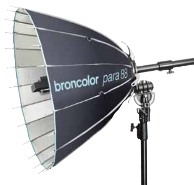
Para 88 P kit | 33.483.00