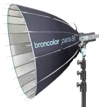
Para 88 réflecteur | 33.482.00